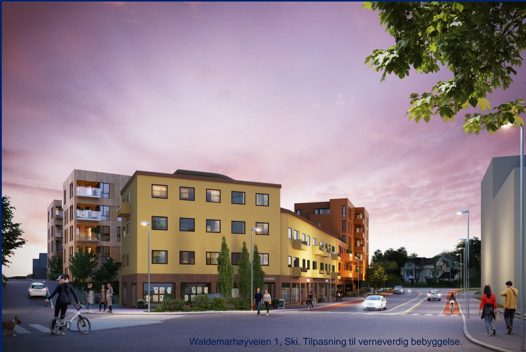
Waldemarhøyveien 1, Ski. Tilpasning til verneverdig bebyggelse.